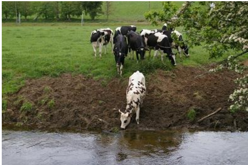
Exemple d'accès non restreint du bétail à une rivière. On observe sans mal les effets du piétinement.