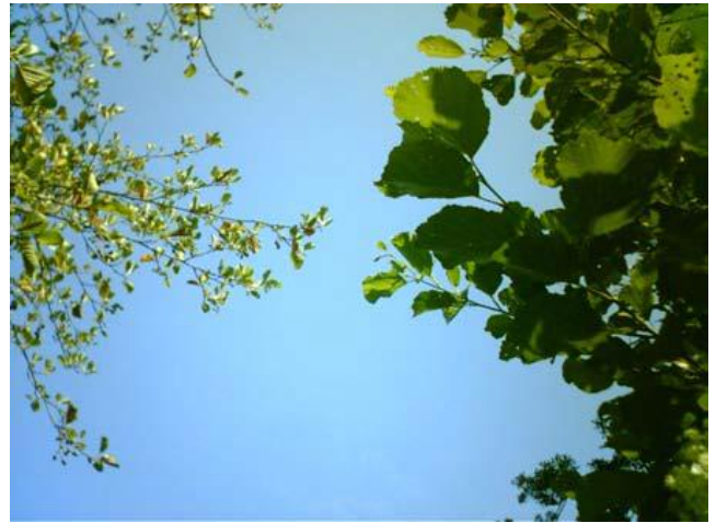
Feuillage d'un arbre malade (à gauche) et d'un arbre sain (à droite)