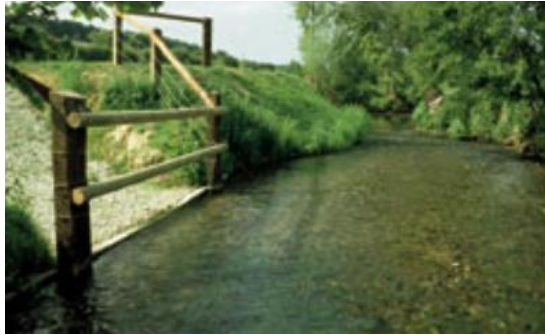
Exemple d'accès restreint à une rivière pour le bétail, évitant le piétinement et les excréments dans celle-ci tout en permettant l'abreuvement. Photographie d'après CATER BN (2001).