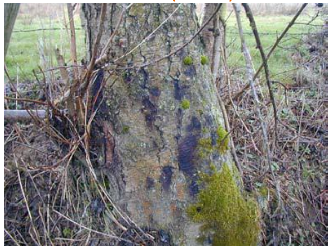
Tâches noirâtres sur le tronc d'un arbre adulte

Quelques-uns des indices de la présence de Phytophthora alni sur l'aulne d'après FREDON et al. (2007).