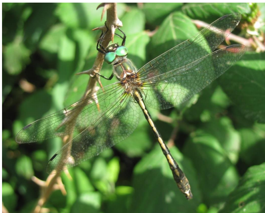
Mâle de la Cordulie à corps fin.

Dans notre région, les données actuelles semblent globalement refléter un assez bon état de conservation des populations de l'espèce ; néanmoins, cette vision devient relativement plus nuancée en examinant en détail différents tronçons de certaines rivières considérées comme les bastions régionaux de l'espèce (exemple : rivière Drôme). De plus et surtout, il n'en est pas de même dans d'autres secteurs géographiques voisins. Par exemple, cet état est nettement plus précaire en Pays de la Loire, où nombre de rivières ne conviennent plus à cette cordulie actuellement. Elle revêt donc un fort enjeu de conservation , y compris dans notre région qui possède encore de belles populations. Ces dernières peuvent être maintenues, voire favorisées par des mesures de gestion assez simples qui sont exposées dans le présent document.