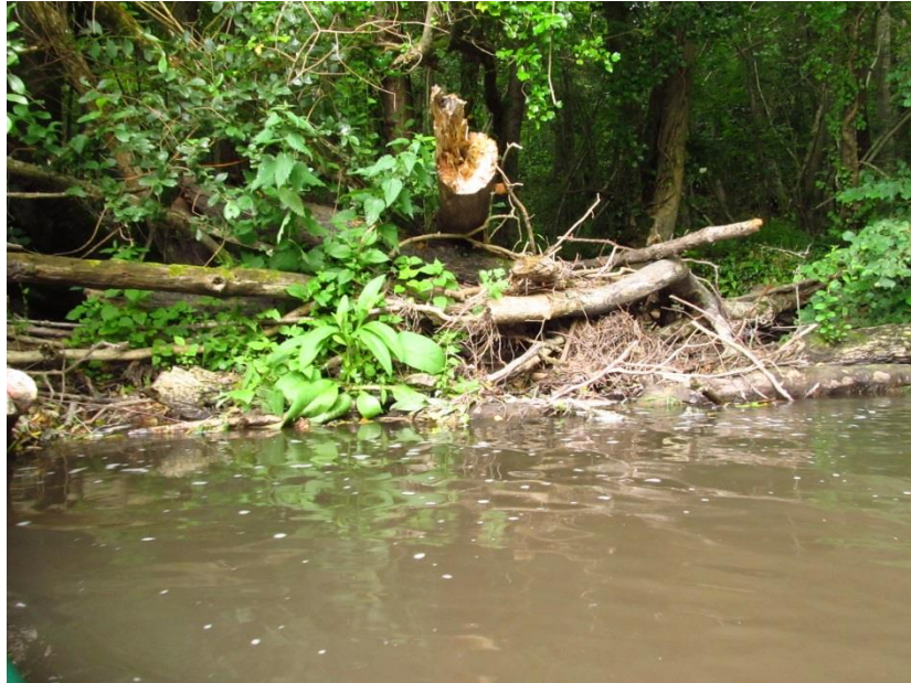
Embâcle assez conséquent sur la Drôme