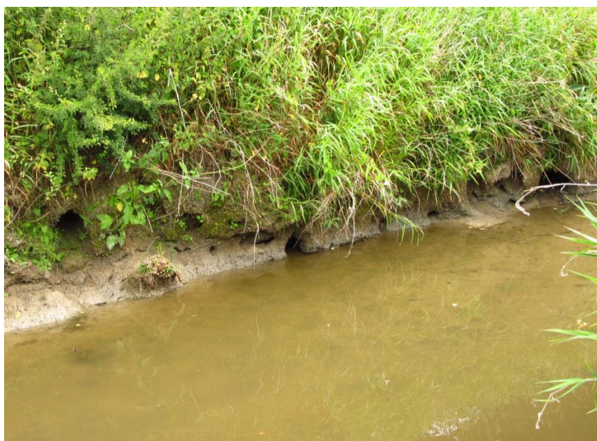
Terriers de ragondin sur une berge de rivière