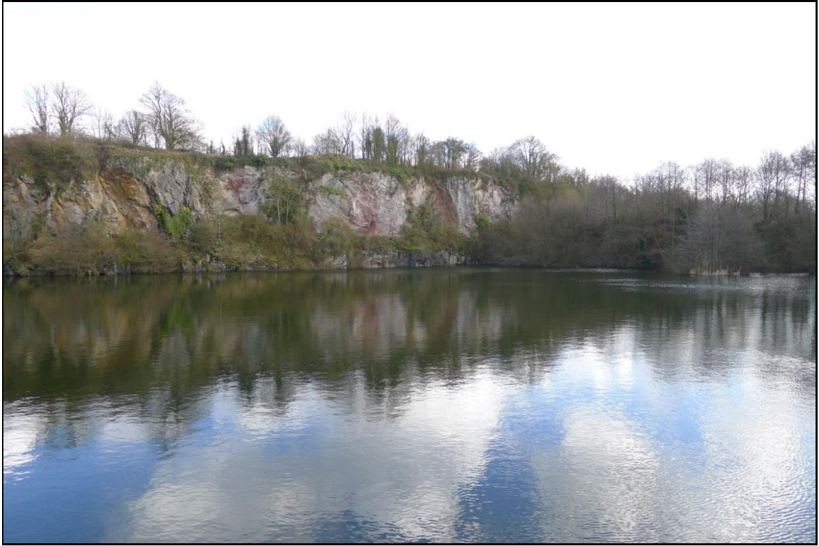
Exemple de milieu stagnant où vit Oxygastra curtisii : plan d'eau de la carrière de la Meauffe (Manche).

Comme écrit plus haut, la Cordulie à corps fin peut, dans de rares cas, être trouvée en milieu stagnant, notamment dans d'anciennes carrières en eau telles que celle illustrée ci-dessous.