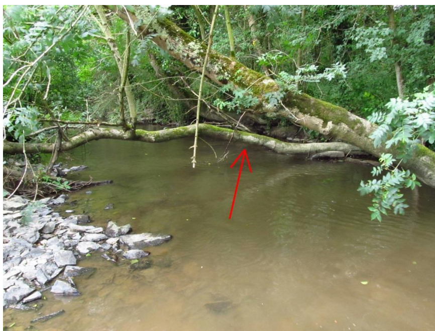
Exemple d'un arbre considéré comme « très incliné », indiqué par une flèche. Le sujet au premier plan n'est pas compris dans cette considération.