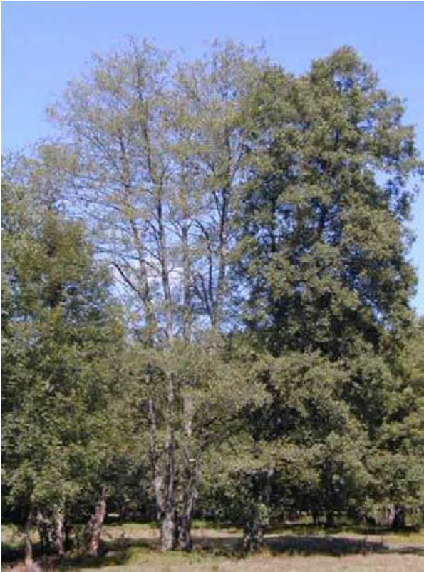
Aulne malade entouré d'aulnes sains

Phytophthora et de sa dissémination sont développés dans une fiche spécifique diffusée par la CATER ( http://www.caterbn.fr/fichiers/mediatheque/documents/aulnes.pdf ).