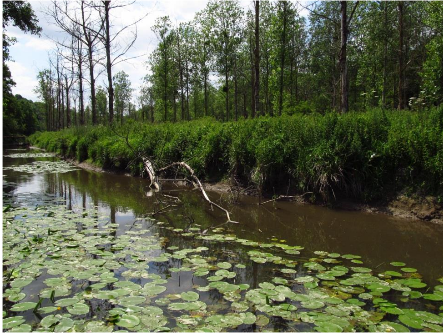
Berge dénaturée par la plantation d'une peupleraie, très défavorable à la Cordulie à corps fin.