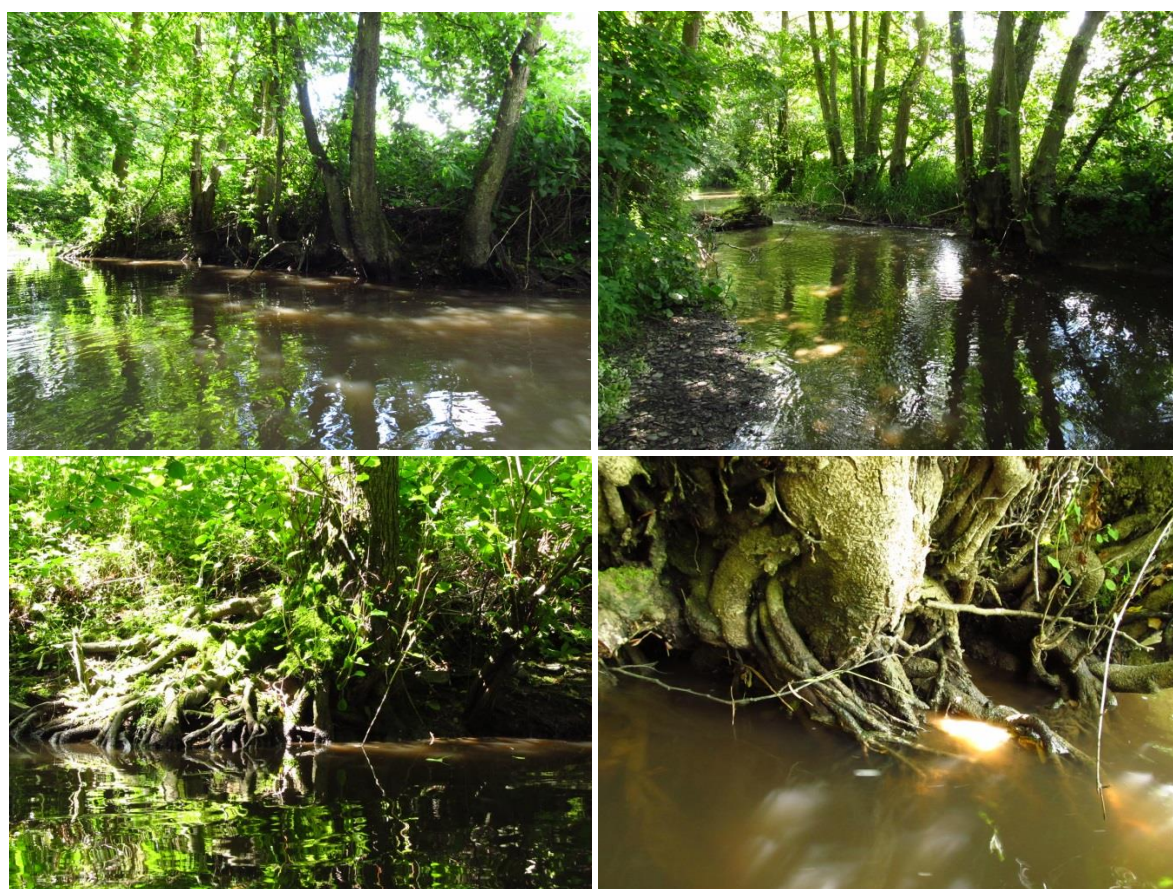
Rivière Drôme à Balleroy : vues de portions où l'aulne domine nettement et vues de systèmes racinaires denses et en partie immergés.

En dehors de leurs habitats de reproduction, les adultes de Cordulie à corps fin peuvent exploiter d'autres milieux. En période de maturation, ils peuvent se rencontrer dans des friches et fourrés, dans des allées forestières, des plantations ou encore dans le bocage. Ce dernier, lorsqu'il est situé à proximité d'un cours d'eau favorable, est régulièrement utilisé pour l'alimentation, notamment pendant les 15-20 jours qui suivent l'émergence. Cette espèce fait preuve d'une bonne capacité de dispersion quand aucun habitat de maturation très favorable n'est présent à proximité ou en cas de « surpopulation ».